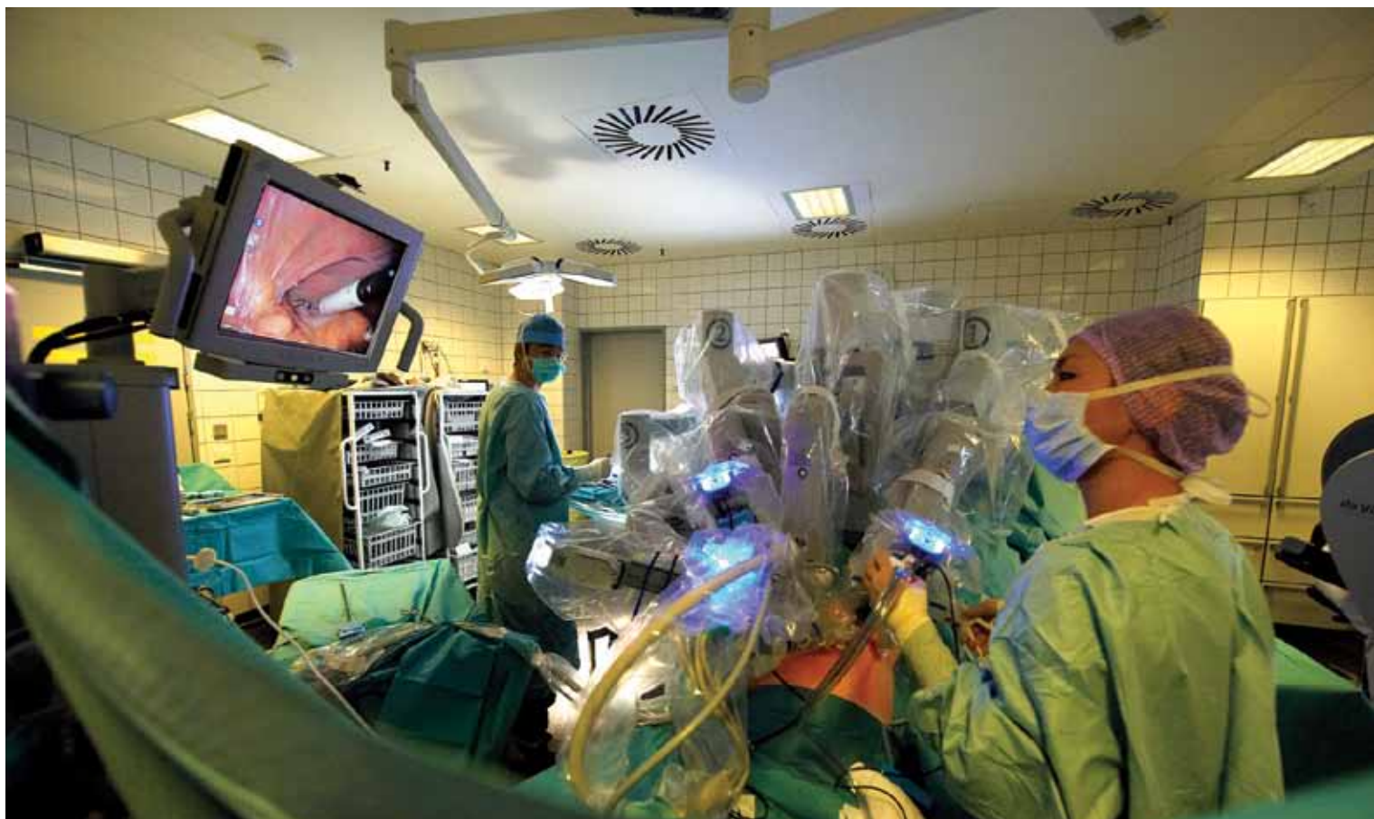
Prostatacancer Patientforeningen arbejder aktivt for at sætte fokus på de nyeste behandlingsmetoder, som fx operationer baseret på robotteknologi.

Prostatacancer Patientforeningen samarbejder med Kræftens Bekæmpelse. Du kan læse mere om patientforeningen på www.propa.dk .