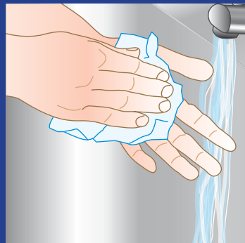
7. Hænderne skylles grundigt under rindende tempereret vand. Hænderne tørres/dupes omhyggeligt i papirhåndklæde