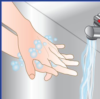
6. ..... og fra håndfladen