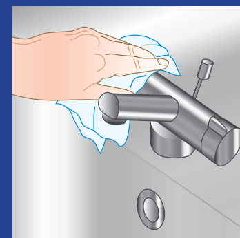
8. Vandhanen lukkes med det brugte papirhåndklæde. Anvend eventuelt hudplejcreme efterfølgende