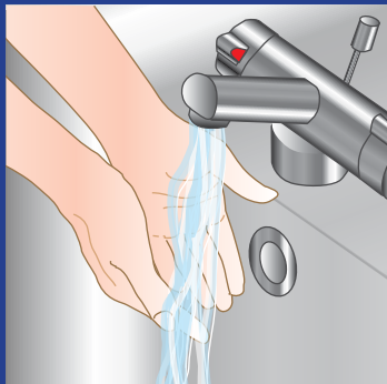
1. Skyl hænder og håndled under rindende tempereret vand