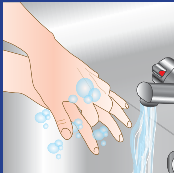
5. Vask mellem flettede fingre fra håndryggen - Venstre hånds håndflade mod højre hånds håndryg og omvendt