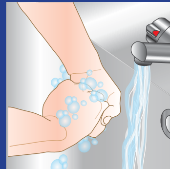
4. Vask oversiden af neglene med hænderne knyttet