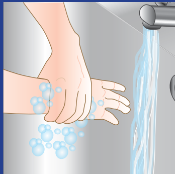
2. Sæben fordeles grundigt på hænder og håndled. Hænder og håndled skal mekanisk bearbejdes i minimum 15 sekunder